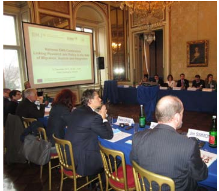
Internationale Konferenz des EMN in Wien, Dezember 2011

Eine der großen Herausforderungen des Netzwerks ist die Vergleichbarkeit der Ergebnisse. Um diese zu verbessern, hat das EMN in einem mehrjährigen Arbeitsprozess ein Glossar erstellt, welches die Anwendung einer ähnlichen Terminologie in allen nationalen Berichten sicherstellt.