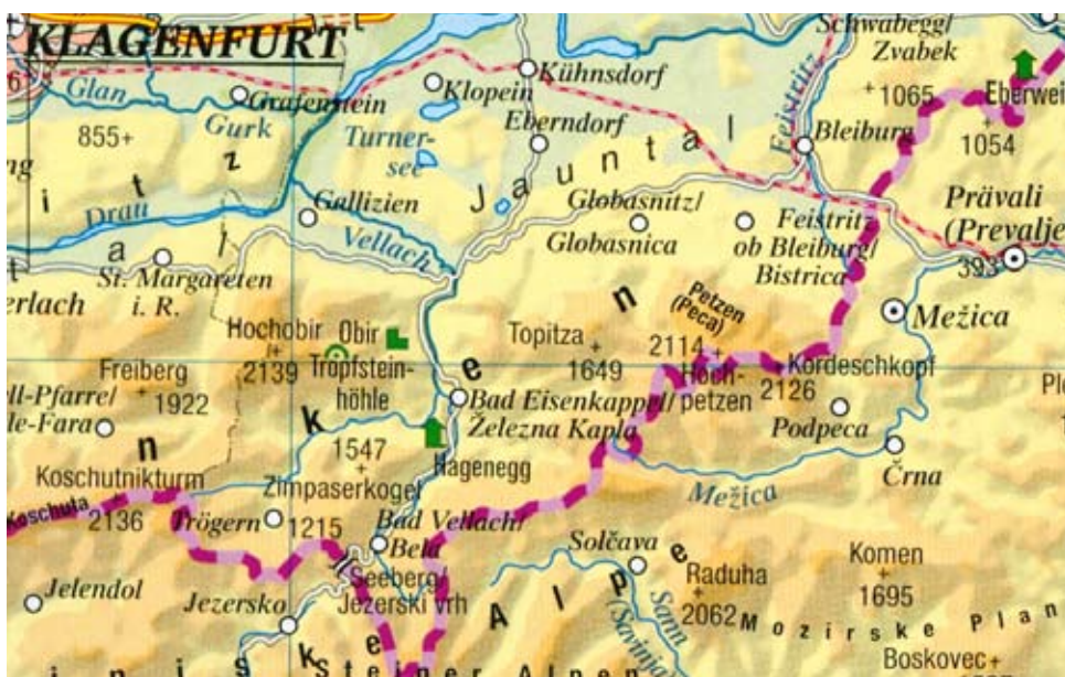
Ausschnitt aus Großer Kozenn-Atlas, hrsg. v. Ed. Hölzel 2011, S. 27

Neben dem „Geographischen Namenbuch Österreich“ und der „Geographischen Namendatenbank Österreich“ hat die AKO bisher „Toponymic Guidelines for Map and other Editors“, „Allgemeine Regeln für die deutsche Rechtschreibung geographischer Namen“ sowie „Vorschläge zur Schreibung geographischer Namen in österreichischen Schulatlanten“ als Empfehlungen veröffentlicht. Eine aktualisierte Neubearbeitung der 1994 publizierten „Vorschläge“ wird demnächst unter dem Titel „Empfehlungen zur Schreibung geographischer Namen in österreichischen Bildungsmedien“ im Verlag der Österreichischen Akademie der Wissenschaften erscheinen (nähere Informationen unter www.oeaw.ac.at/dinamlex/AKO , http://verlag.oeaw.ac.at/ oder peter.jordan@oeaw.ac.at ).