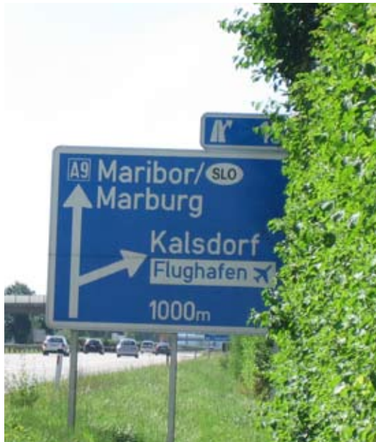
Verkehrshinweistafel an der Pyhrnautobahn südlich von Graz

sind zwar nur 0,2 % der Bevölkerung, doch handelt es sich eben um Reste einer alteingesessenen Gruppe, was den Namen Marburg nach der aktuellen Definition der Vereinten Nationen sogar zu einem Endonym, zu einem „Namen von innen“ macht.